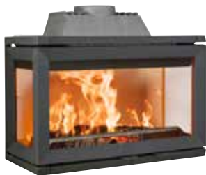
JØTUL I 620 FRL UPUST 1 680,-* TERAZ 6 720,-* Było 8 400,-*