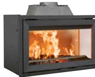
JØTUL I 620 FR UPUST 1 660,-* TERAZ 6 640,-* Było 8 300,-*