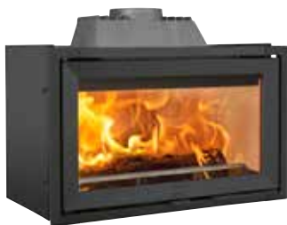
JØTUL I 620 F UPUST 1 640,-* TERAZ 6 560,-* Było 8 200,-*