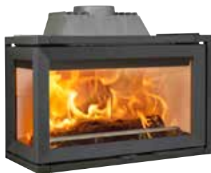
JØTUL I 620 FL UPUST 1 660,-* TERAZ 6 640,-* Było 8 300,-*